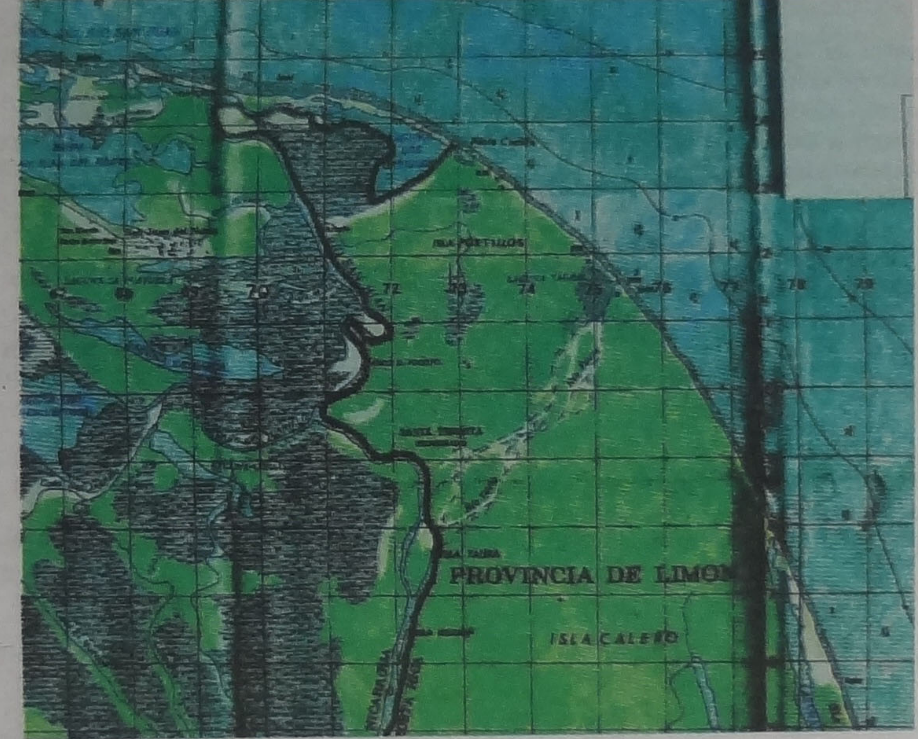
La margen derecha del río San Juan es territorio costarricense. IGN PARA LN

Corte de La Haya Fallo emitido 13 de julio del 2009